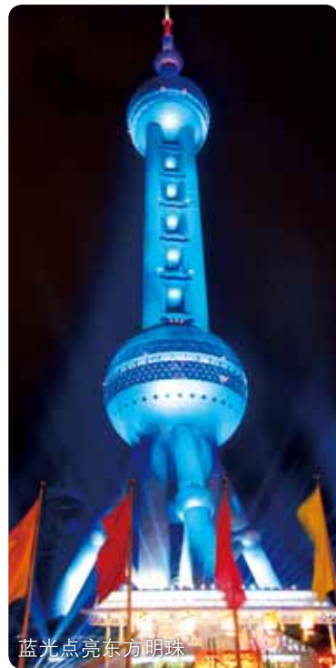
蓝光点亮东方明珠

限于篇幅，各地开展“蓝光行动”的具体活动在此不再一一介绍。温馨而祥和的蓝光，点亮了全国各大城市的地标建筑，为城市的上空带来片片和谐与宁静，也照进了千万个糖尿病患者的内心深处，点亮了人们战胜糖尿病的希望，