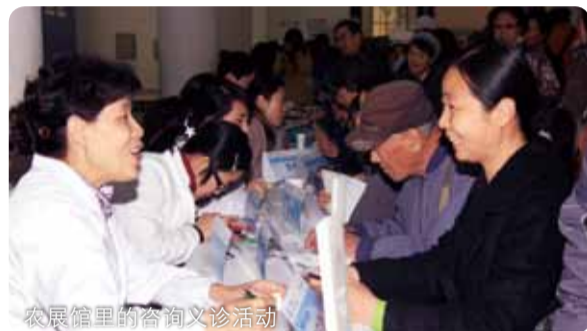
农展馆里的咨询义诊活动

11月13日,北京全国农业展览馆5号厅里人头攒动,“蓝光行动”在这里举办大型糖尿病宣传教育活动,开展高危人群筛查、健康大讲堂、知识展示、义诊、健身操、患者沙龙等活动。1000余名慕名而来的京城群众不避深秋寒冷的气候,来到农展馆,大家排起长队,秩序井然地接受糖尿病筛查、聆听健康大讲堂讲