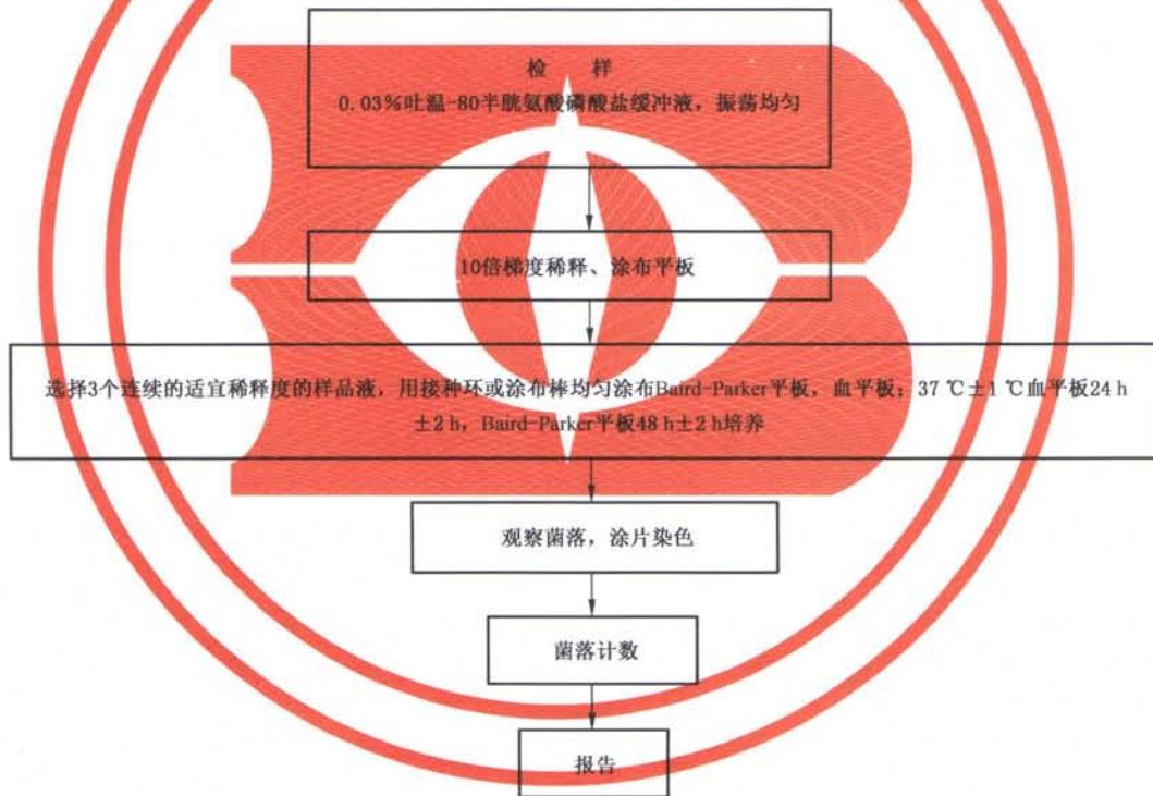
图 C.1 检验程序